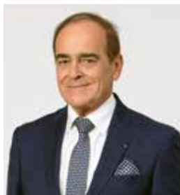
Jean-Pierre Bouquet Maire de Vitry-le-François

L'aménagement du nouveau giratoire Carnot est la première étape d'une requalification beaucoup plus ambitieuse et qui va s'étaler sur plusieurs années : celle de la départementale qui traverse Vitry depuis le carrefour avenue Jean Juif / Faubourg de Saint-Dizier jusqu'au carrefour de l'Etoile qui mène au lycée François 1 er et à l'avenue du Général de Gaulle.