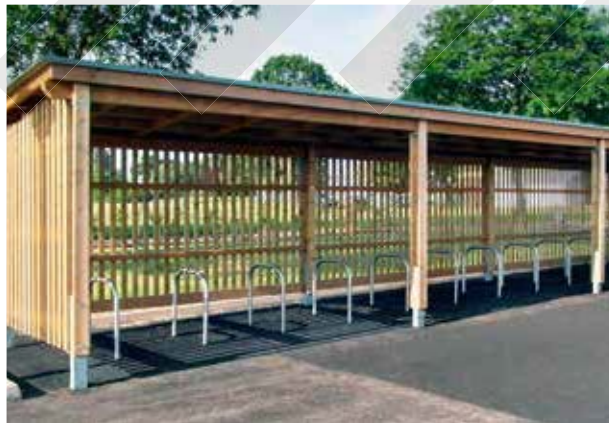
Abri à vélos à Lille