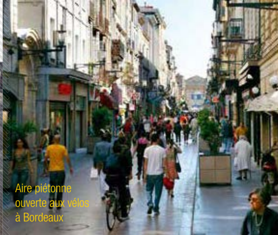
Aire piétonne ouverte aux vélos à Bordeaux