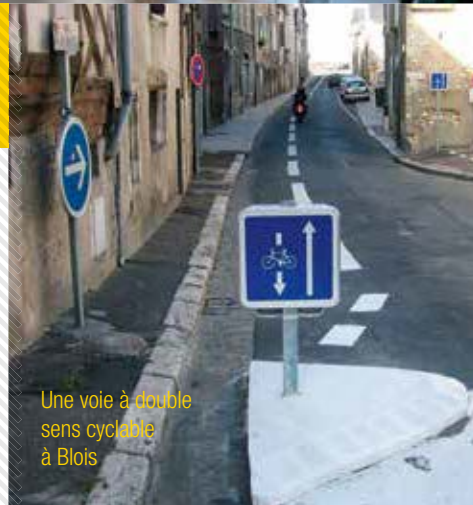
Une voie à double sens cyclable à Blois