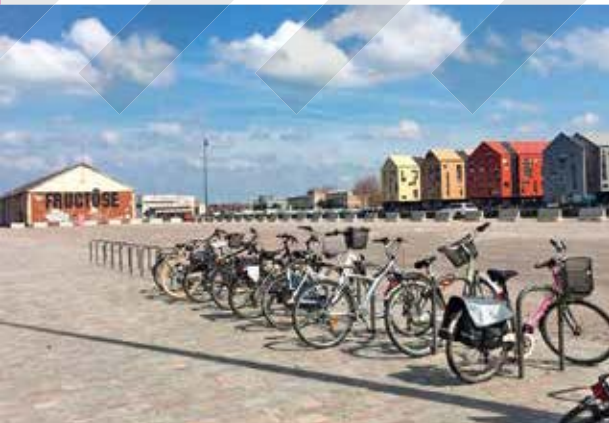
Arceaux à Dunkerque