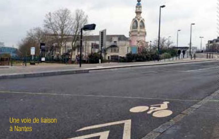
Une voie de liaison à Nantes